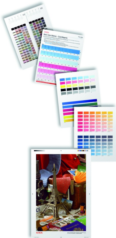
Gli strumenti integrati di calibrazione del colore offrono esattamente i risultati desiderati.